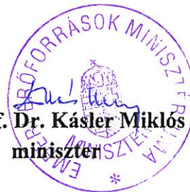
Prof. Dr. Kásler Miklós Prof. Dr. Kásler Miklós miniszter